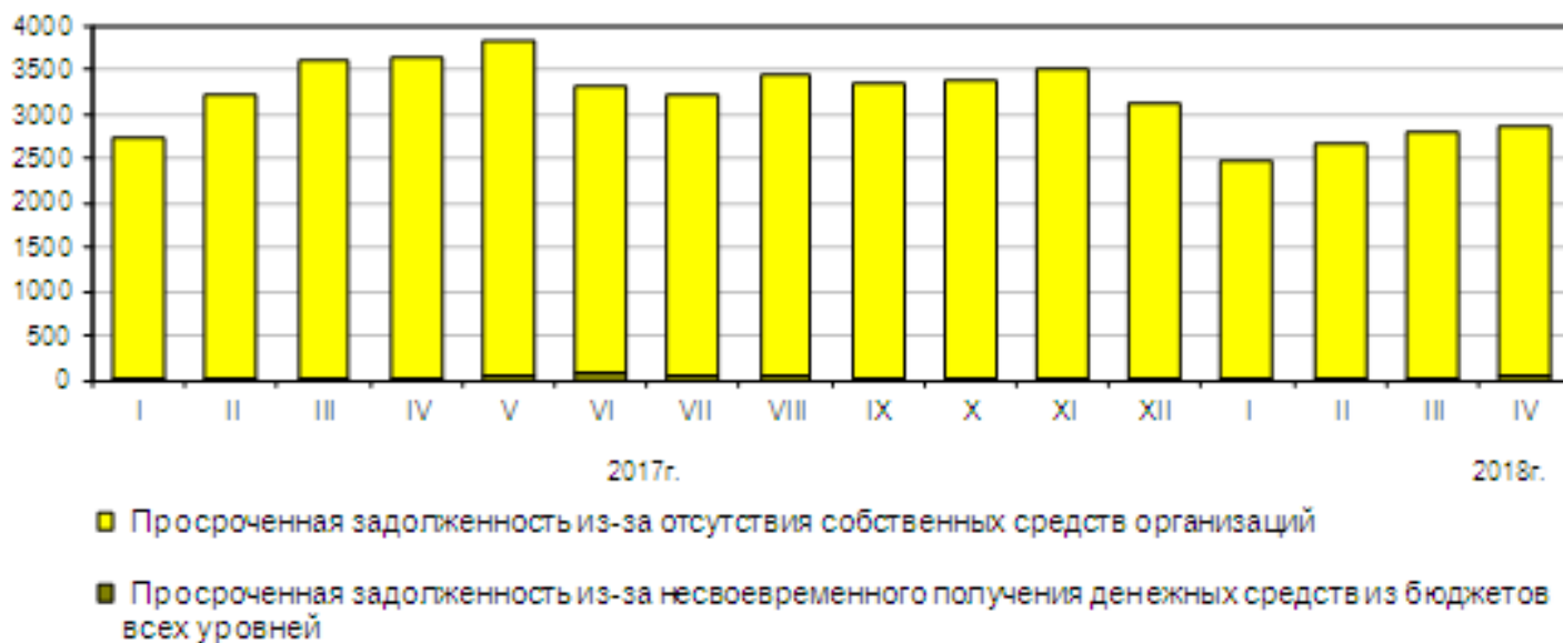
Динамика просроченной задолженности по заработной плате на 1 число месяца, млн.рублей

Из общей суммы невыплаченной заработной платы на долги, образовавшиеся в 2017 г., приходится 1007 млн рублей (35,2%), в 2016 г. и ранее - 1169 млн рублей (40,9%).