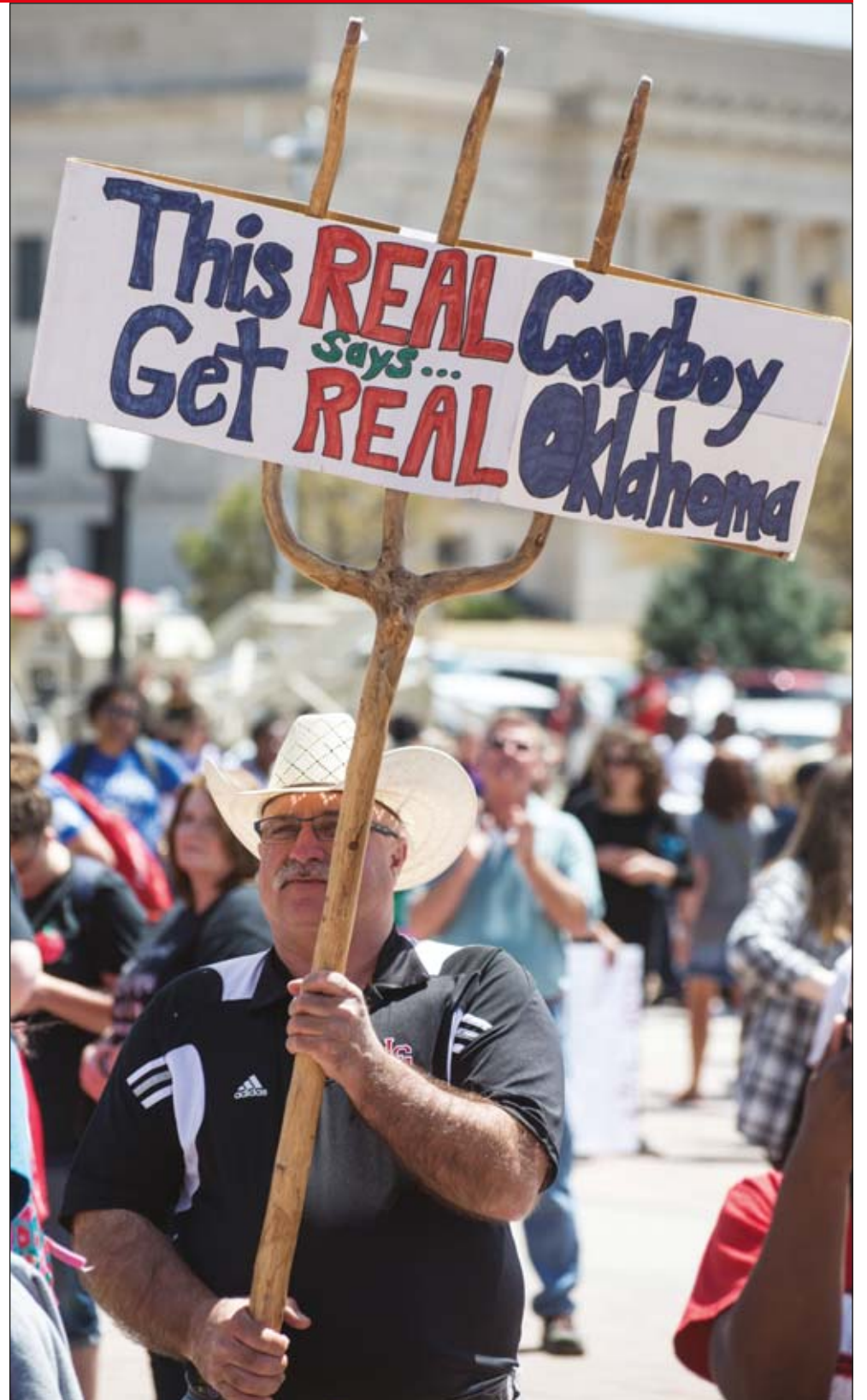
Протест преподавателей в Оклахоме принимает иногда и такую, “ковбойскую” форму. На фото: участник акции у здания Капитолия, Оклахома-Сити, 4 апреля

Профобъединение университетов и колледжей UCU запустило голосование по поводу возможных изменений в пенсионной системе, предложенных объединением работодателей UUK (Университеты Соединенного Королевства) в сотрудничестве с USS после длительных забастовок и продолжительных переговоров. Работодатели предложили своего рода компромиссный вариант: заменить