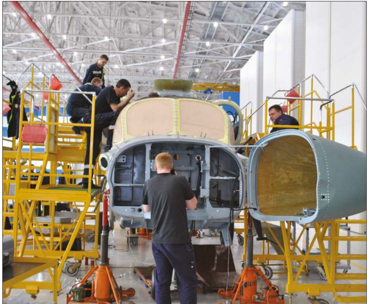
На "Прогрессе" действует полный производственный цикл, начиная с изготовления отдельных деталей и заканчивая сборкой и летными испытаниями. На первых этапах цикла тряпочки, промазанные клеем, отправляются в автоклав (на фото слева), где из них под вакуумом получается сверхпрочный стеклопластик. На финальном этапе происходит сборка вертолета (на фото справа). Визитная карточка завода - вертолет Ка-52 "Аллигатор". В марте 2016 года несколько Ка-52 были переброшены в Сирию, где они используются в различных операциях

ныне обычно прячется за этим названием. Причем инициатива пришла снизу.