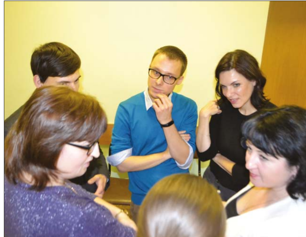
Семинар-совещание с председателями молодежных советов и комиссий по работе с молодежью территориальных и первичных профорганизаций, выходящих на обком профсоюза.

В 2017 году в Раменском комплексном центре социального обслуживания населения при увольнении по п. 2 ст. 81 ТК РФ (расторжение трудового договора по инициативе работодателя) 21 работнику зарплату и выходные пособия выплатили не полностью. В горкоме профсоюза людям помогли составить исковые заявления в районный суд, где интересы членов профсоюза представлял специалист горкома. В результате профсоюз удалось добиться выплаты зарплату и выходных пособий в полном объеме. А вино-