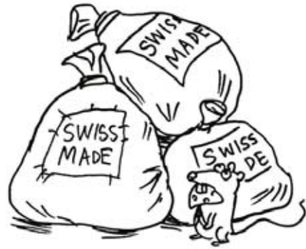
Рисунок: Дмитрий Петров

Интересно же вот что. На самом деле к такому свинству швейцарцев подталкивает природная бережливость. Просто утилизация отходов в Швейцарии стоит непомерно много (возможный штраф в 150 евро от французской стороны "мусорщиков" не останавливает). Да и вообще,