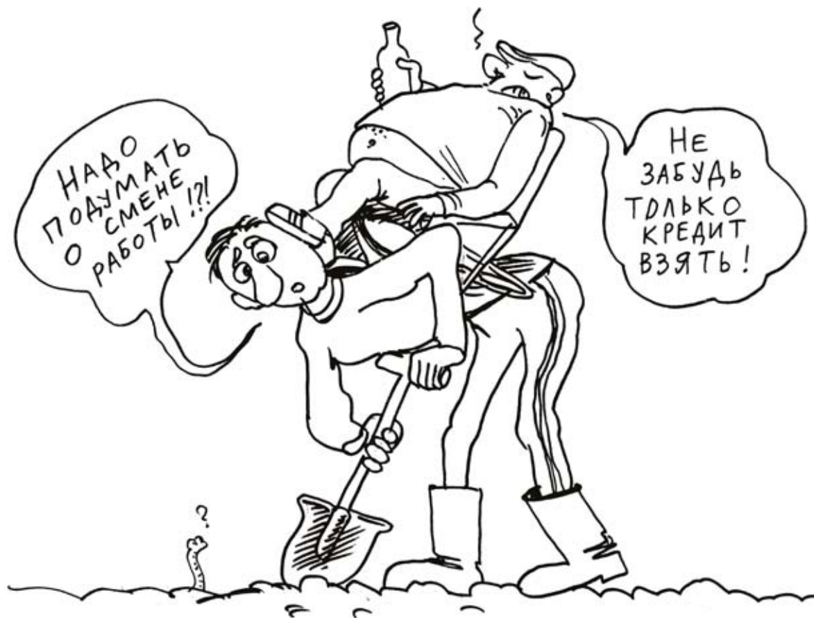
Рисунок: Дмитрий Петров